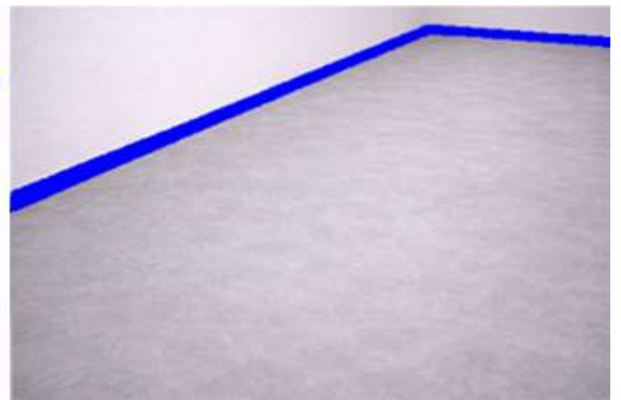
Termine la superficie y deje secar