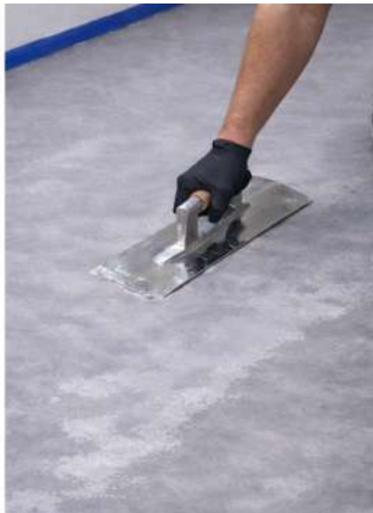
COMIENZE A APLICAR