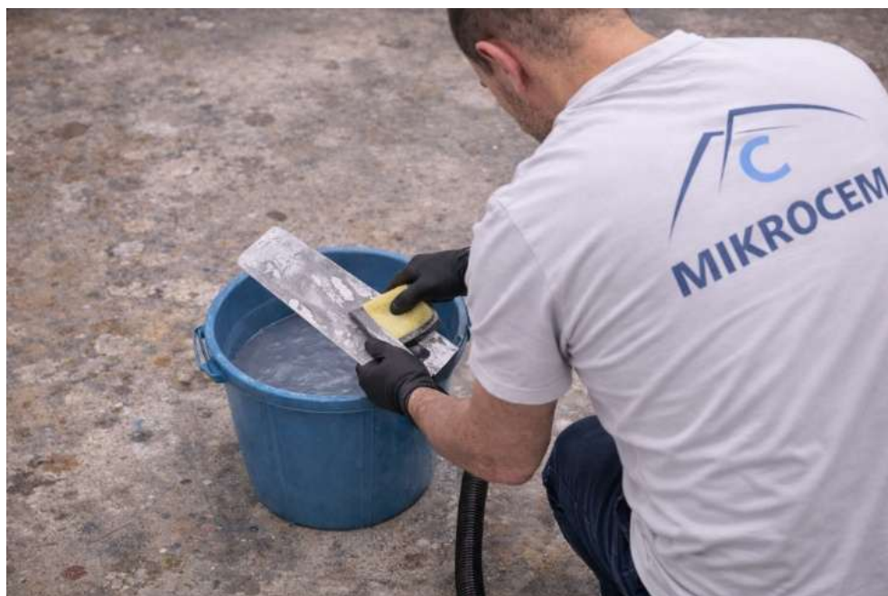
LIMPIE LA LLANA REGULARMENTE Y AL TERMINAR