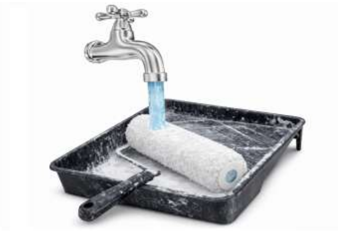
LIMPIE LA HERRAMIENTA