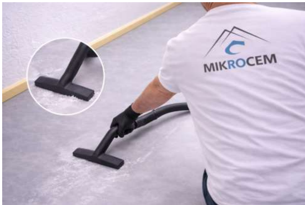
(ASPIRE EL POLVO GENERADO AL LIJAR)