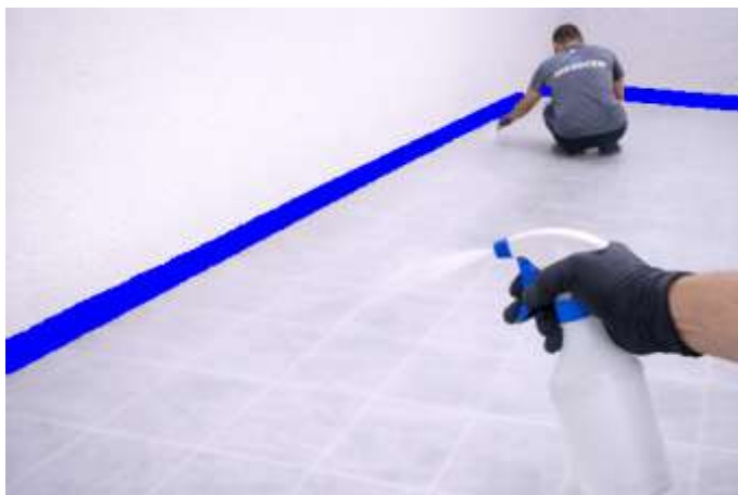
Humedezca ligeramente la superficie

ABRA LA CUBETA DE BASE Y REMUEVA EL MICROCEMENTO SI ES NECESARIO