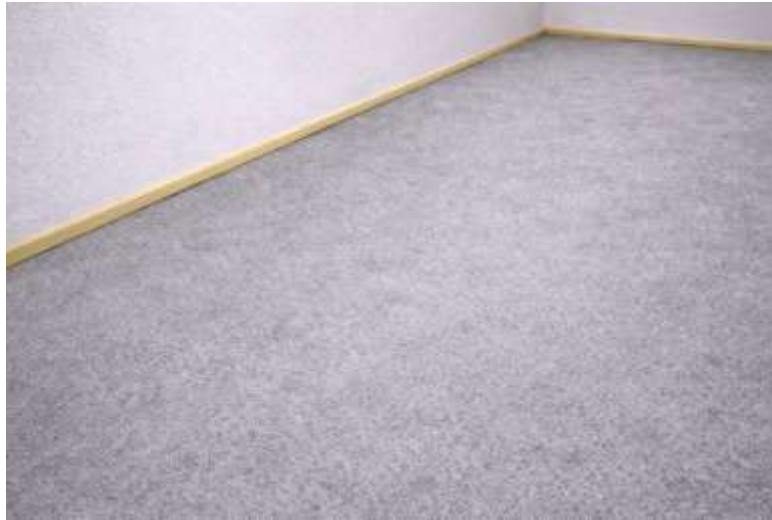
(PRIMERA CAPA DE BASE TERMINADA)