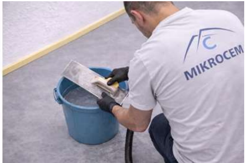
LIMPIE LA LLANA REGULARMENTE