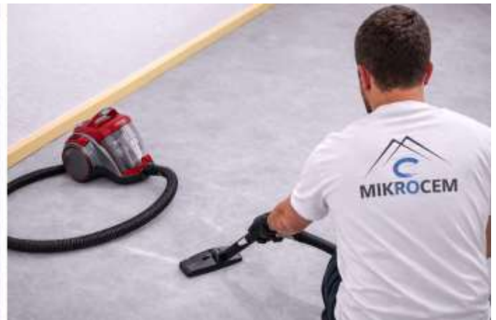
ASPIRE EL POLVO GENERADO