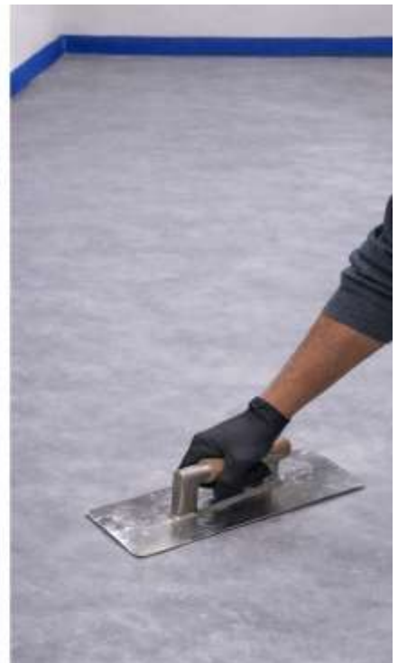
TERMINE LA SUPERFICIE