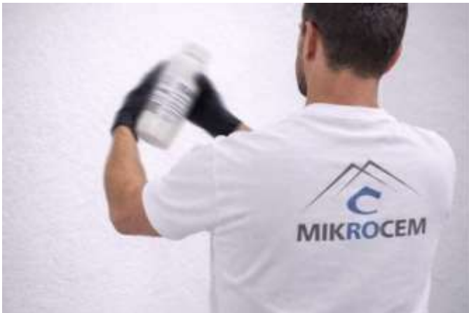
AGITE ENÉRGICAMENTE EL SELLADOR