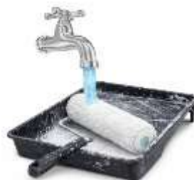
LIMPIE LA HERRAMIENTA CON AGUA