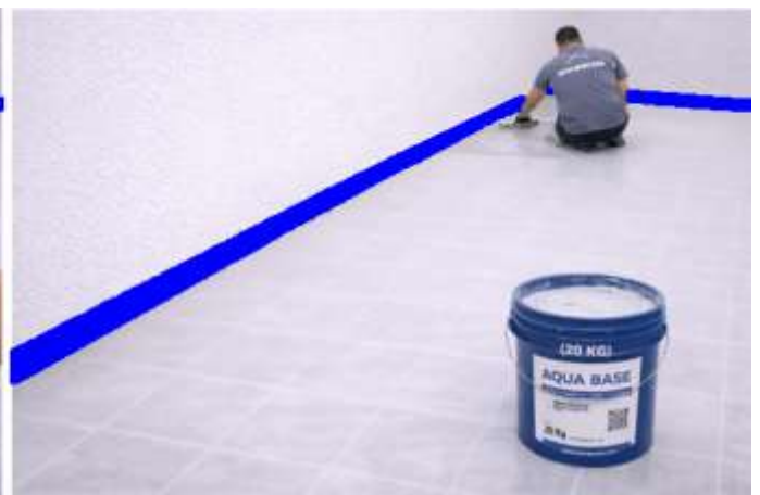
Comience a aplicar BASE