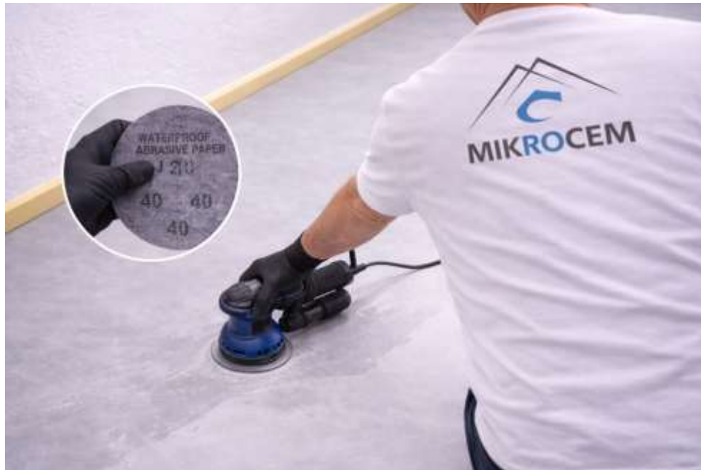
(LIJE EL MICROCEMENTO BASE CON LIJA DE AGUA GRANO 40)