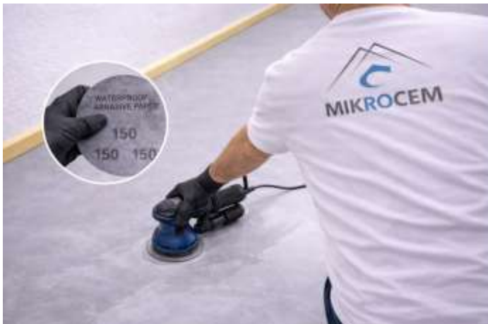
LIJE LEVEMENTE CON LIJA DE GRANO 150