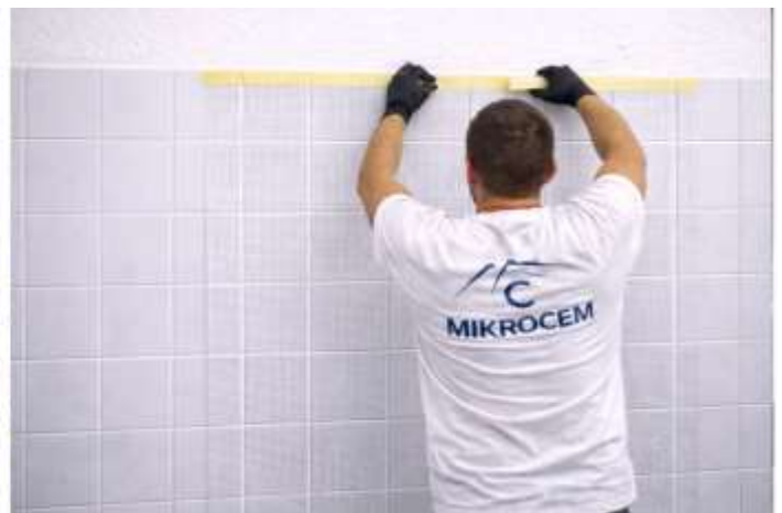
COLOCACIÓN DE MALLA EN MUROS