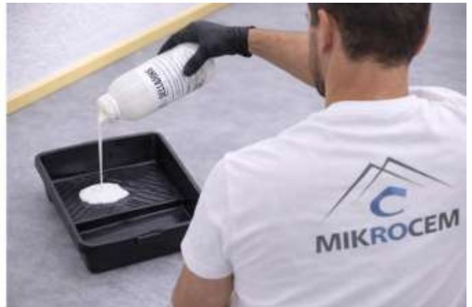
UTILICE UNA CHAROLA PARA PINTURA