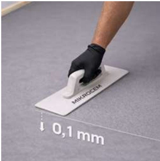
GROSOR DE 0.1 MM