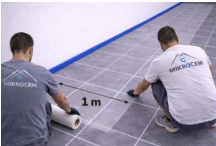
COLOCACIÓN DE MALLA EN PISOS