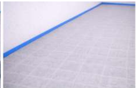
APLIQUE PRIMER SOBRE LA MALLA CUBRIENDO TODA LA SUPERFICIE