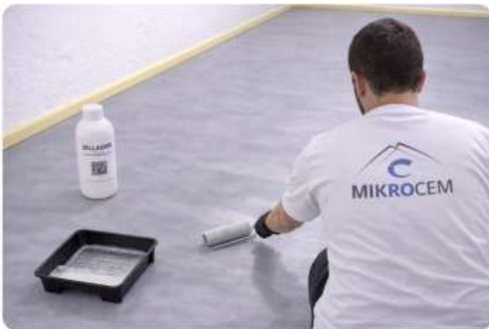
APLÍQUELO POR TODA LA SUPERFICIE