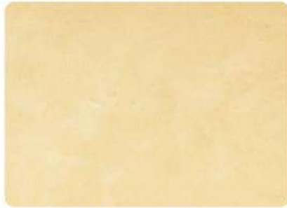
Vainilla / Vanilla