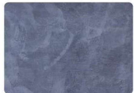
Acero / Steel