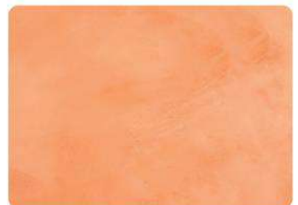
Tundra / Tundra

Los colores mostrados son meramente informativos. MIKROCEM no puede asegurar que una vez aplicado se verán como en las imágenes, ya que eso depende 100% de la resolución del monitor con el que se visualicen o la impresora con la que se imprima