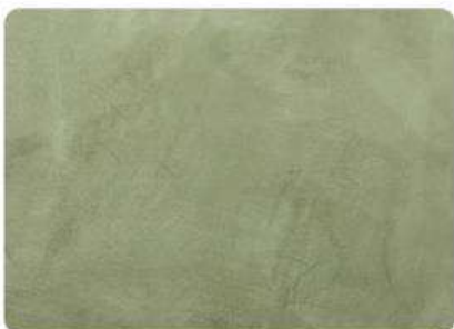
Verde Madeira / Madeira Green