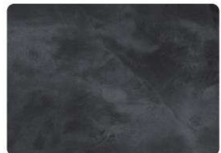
Pizarra / Slate