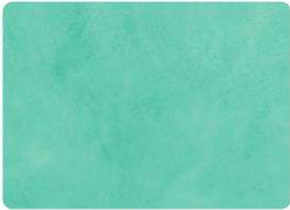
Esmeralda / Emerald