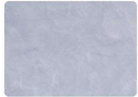
Gris Perla / Pearl Gray