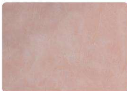
Siena / Siena