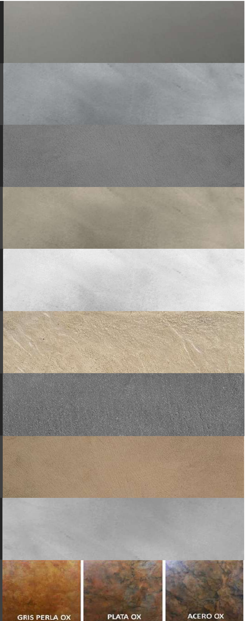
GRIS PERLA OX

MICROCEMENTO OXIDE: Textura similar a un concreto bien "repellado". Se mezcla con Resina Mikrocem. Se utiliza como acabado final o como base para alguno de nuestros "Fino" cuando se aplica sobre muros lisos. Disponible en más de 1,000 colores. De fácil aplicación con llana de acero.