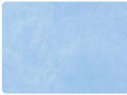
Azul / Blue