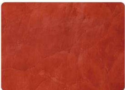
Terracota / Terracotta