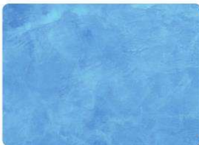
Azul Intenso / Deep Blue