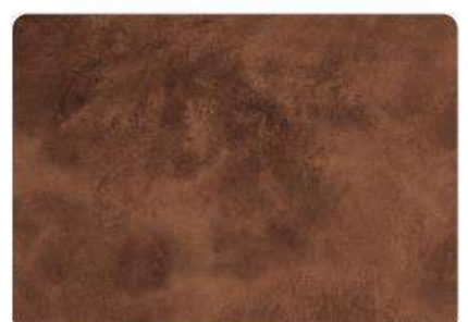
Chocolate / Chocolate

Los colores mostrados son meramente informativos. MIKROCEM no puede asegurar que una vez aplicado se verán como en las imágenes, ya que eso depende 100% de la resolución del monitor con el que se visualicen o la impresora con la que se imprima