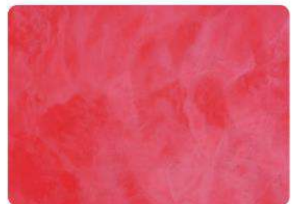
Rojo Cereza / Red Cherry