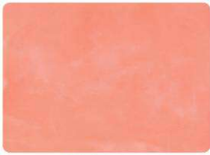
Salmón / Salmon