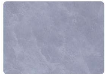
Plata / Silver