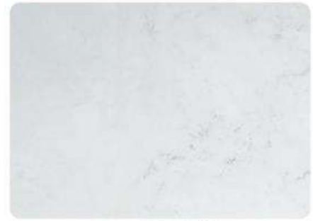
Blanco Roto / White