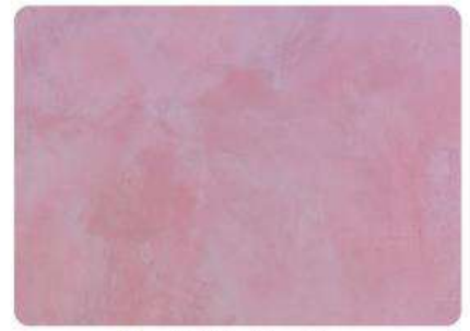
Rosa Pálido / Pale Rose