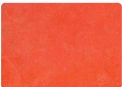
Coral / Coral