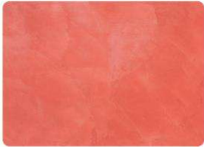
Jaspe / Jasper