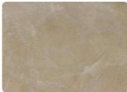
Travertino / Travertino