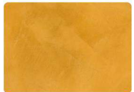
Caramelo / Caramel