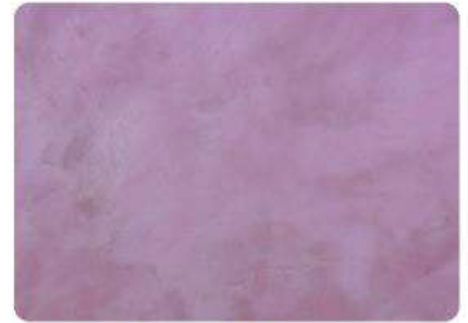
Lavanda / Lavender