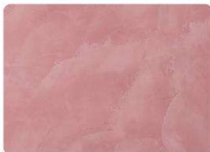
Toscana / Tuscan