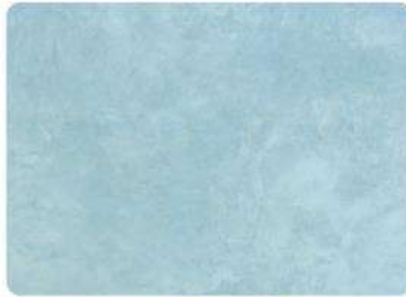
Azul Ártico / Artic Blue