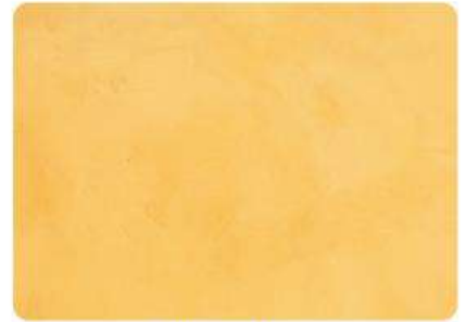
Albero / Albero