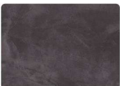
Wengue / Wengue