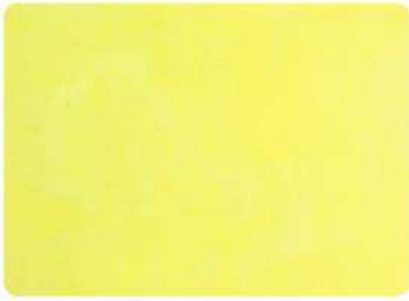
Limón / Lemon