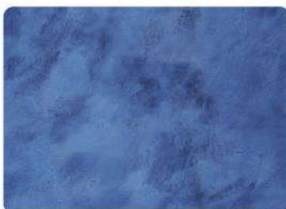
Azul Marino / Navy Blue