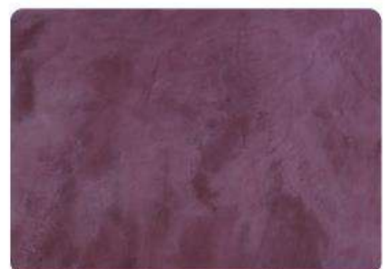
Vino / Wine