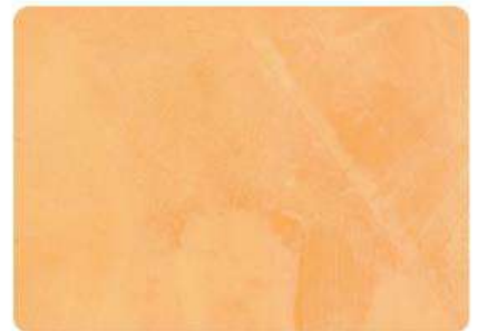
Mango / Mango