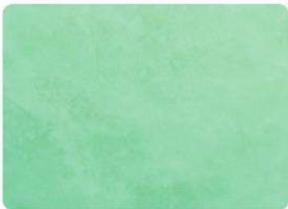
Manzana / Apple