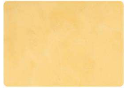
Arena / Sand