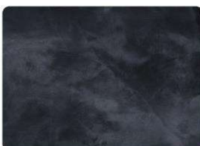
Antracita / Anthracite