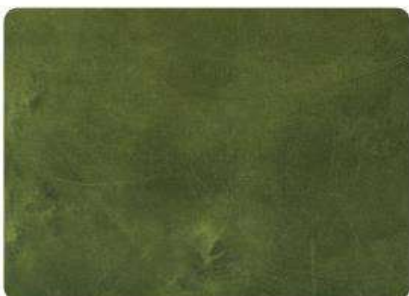
Verde Aceituna / Olive Green